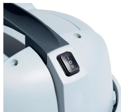
Une double vitesse pour un usage sur-mesure dans une grande variété d'applications