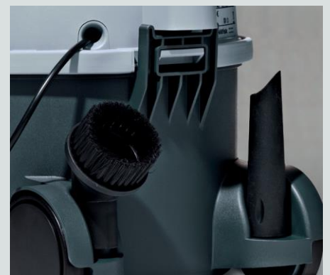
Intégré au châssis le rangement des accessoires vous permet de garder en permanence tous les outils dont vous avez besoin à portée de main