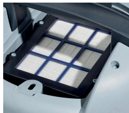
Un niveau de filtration supérieur grâce au filtre d'échappement HEPA