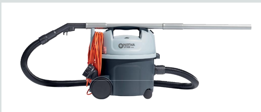
Le VP300 peut être transporté de manière sûre et confortable avec une seule main