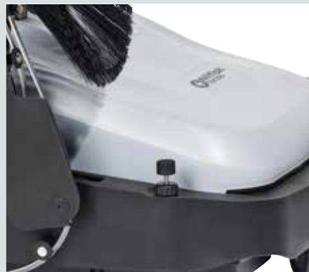
La brosse principale et les brosses latérales peuvent être réglées sans outil