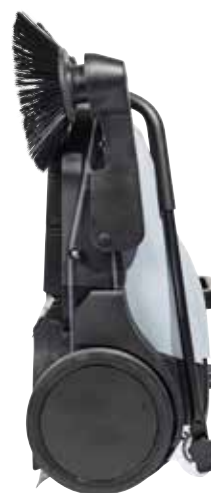
La trémie reste en place même lorsque la balayeuse est stockée en position verticale ou accrochée au mur