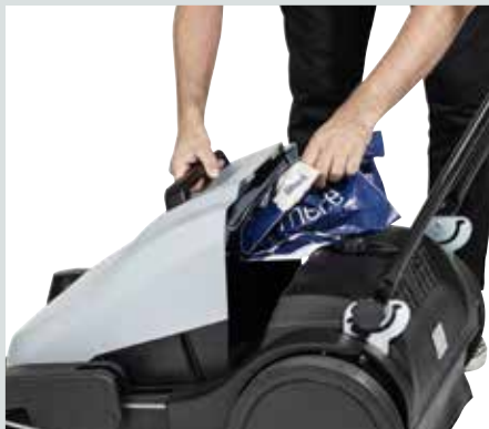
La trémie peut rester ouverte de façon à pouvoir accueillir les gros déchets ou les poubelles