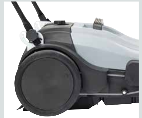
La poignée peut être réglée en fonction de la taille de l'opérateur (3 hauteurs possibles)